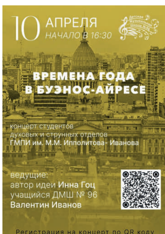
Рис. 3. Афиша (фото из личного архива автора)