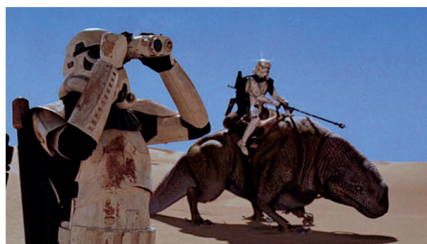
Рис. 1. Кадр из фильма «Звездные войны. Эпизод IV: Новая надежда»