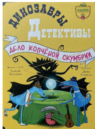
Рис. 5. Обложка книги «Динозавры-детективы. Дело копченой скумбрии», 2024

Порой и сам автор считает необходимым подчеркнуть, что идея — тоже его («придумал и написал», рис. 5).